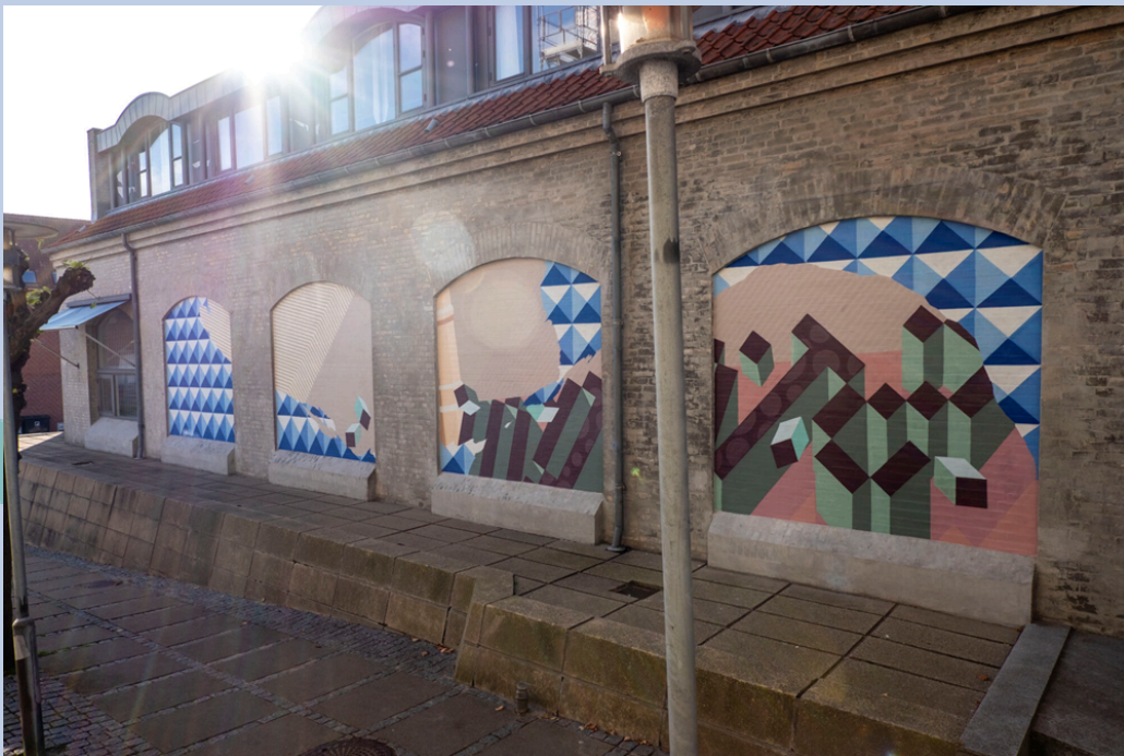
Værk: Storm, Søndergade 34 (2020)