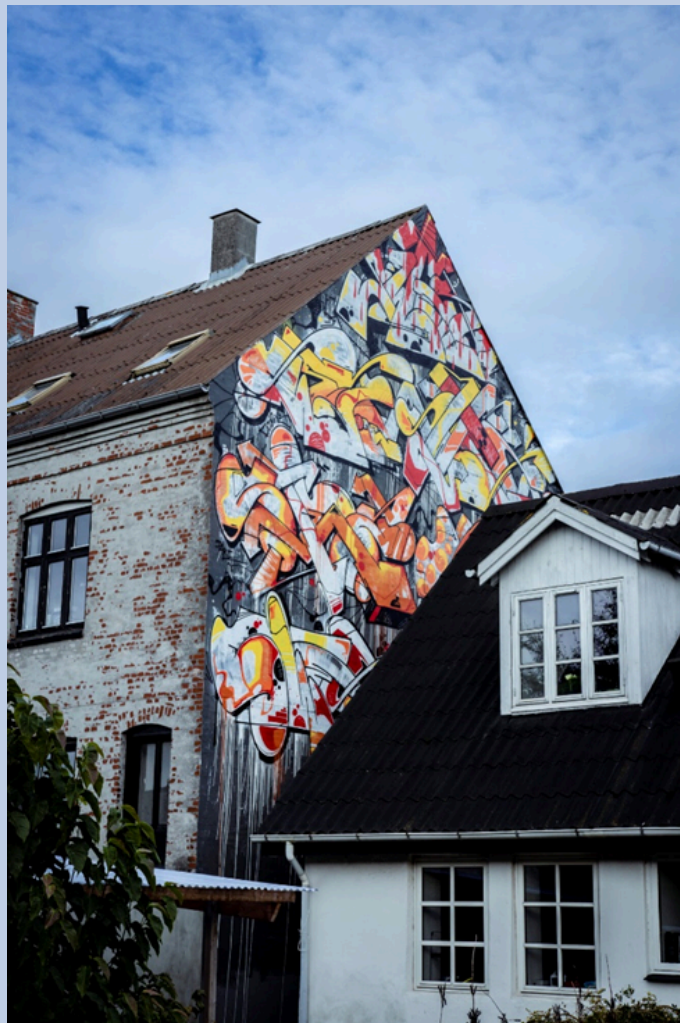
Værk: Swet, Fussinggade 5 (2020)