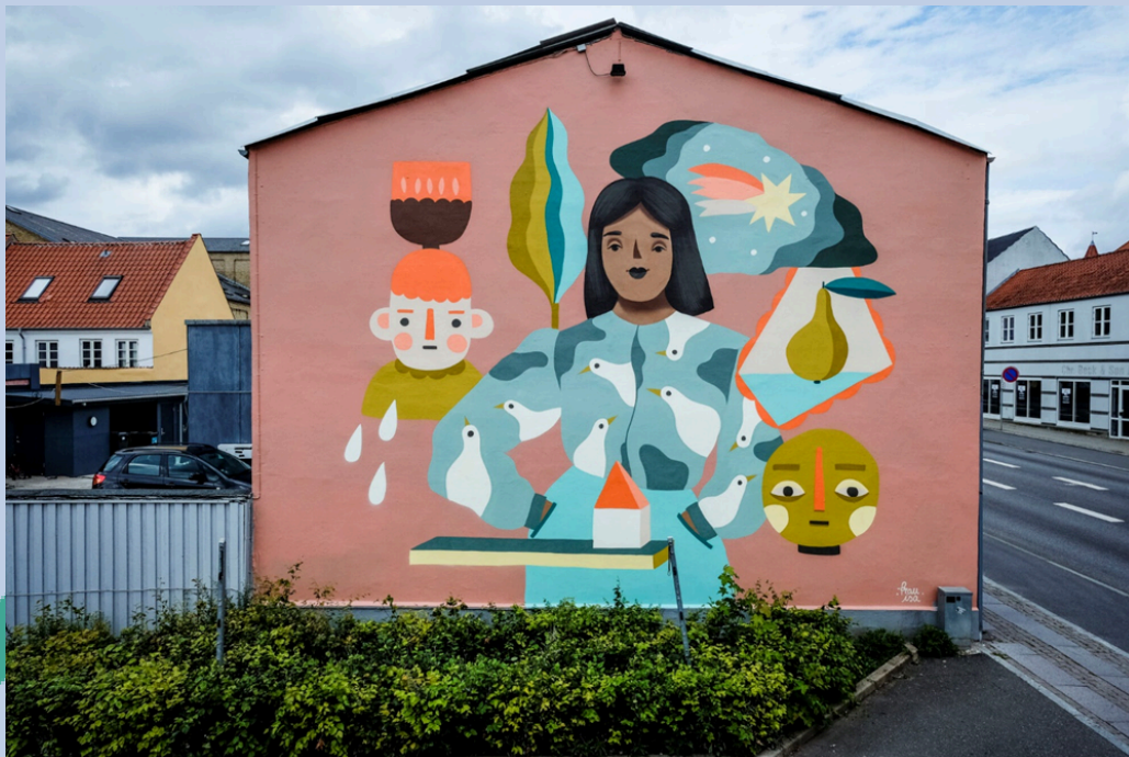
Værk: Fru Isa, Allegade 67 (2021)