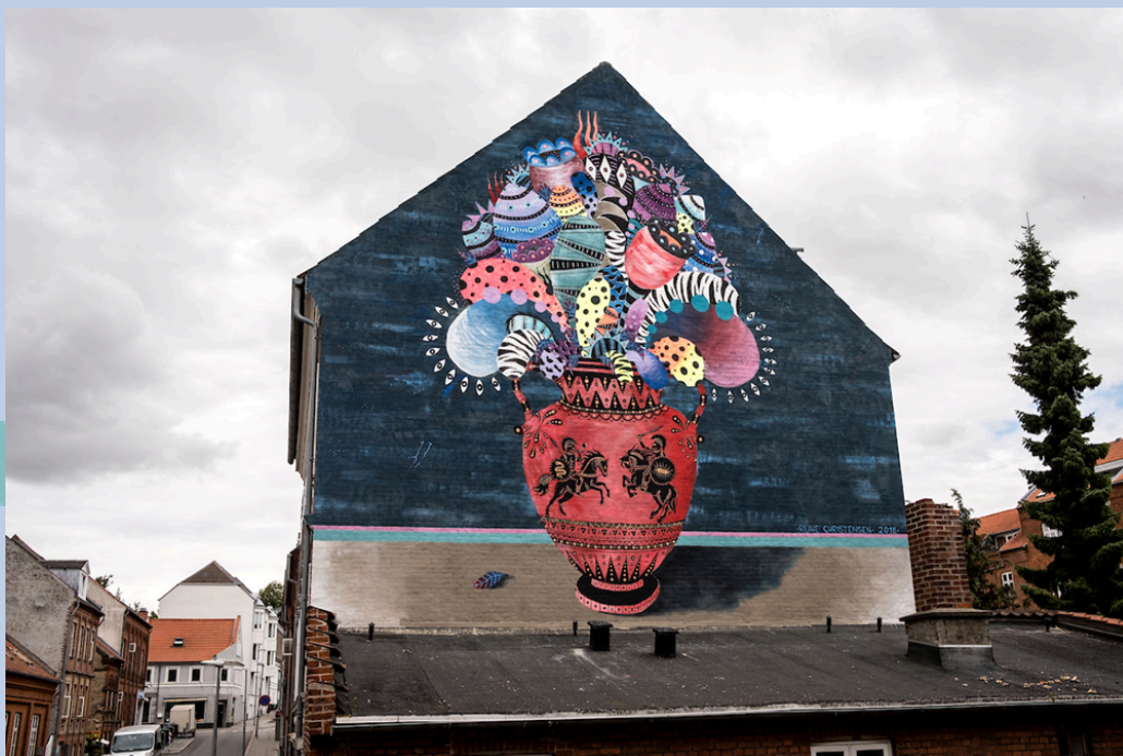
Værk: Rune Christensen, Gersdorffsgade 9 (2018)

Tegn, mal, modeller eller byg din egen vase med inspiration fra Rune Christensens: