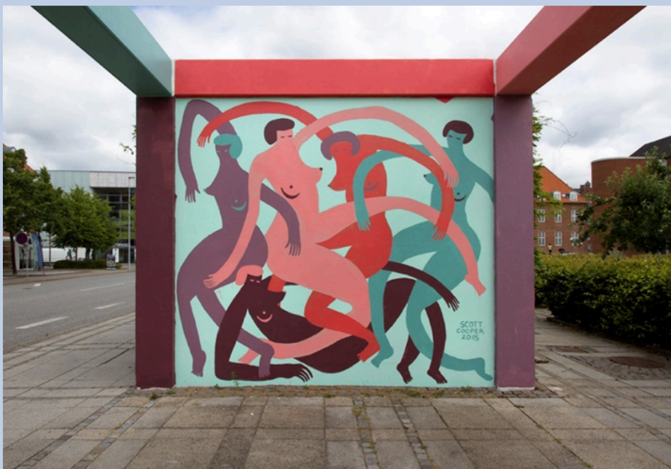
Værk: Scott Cooper, Ribersgade 1 (2015)